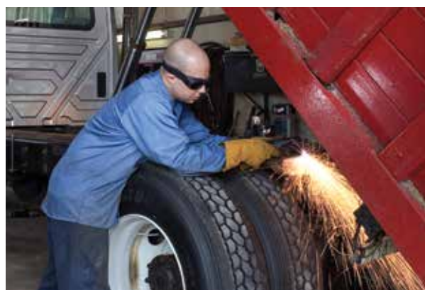
Voertuigreparatie en -aanpassing